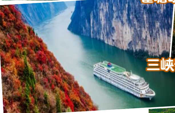
三峡奇迹沿途风光